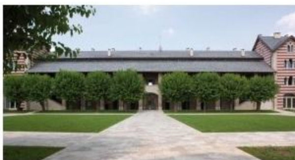
Cascina La Salette